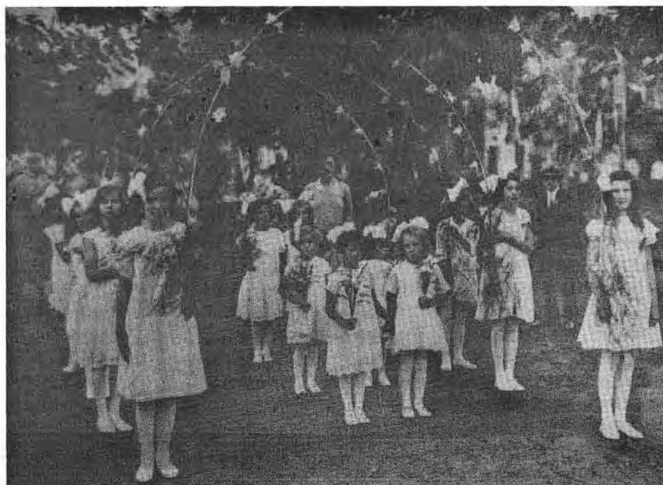
Tuindorp, een sfeervolle wijk, waar het een voorrecht was om op te groeien.